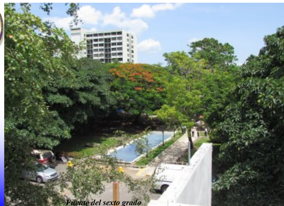
Fuente del sexto grado

Las siguientes cápsulas de información, aunque breves, aspiran a ofrecer una visión general de Notre Dame Secundario (5 to. a 12 mo. grados). Información adicional y otros detalles del Colegio, incluso un paseo virtual, están disponibles en wwwccnd.org .