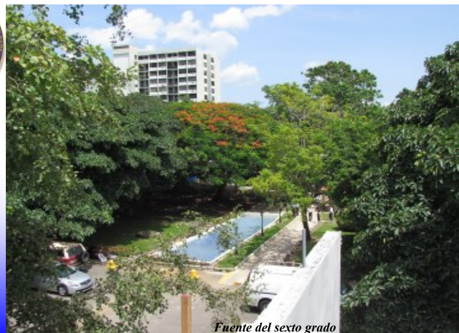
Fuente del sexto grado

Las siguientes cápsulas de información, aunque breves, aspiran a ofrecer una visión general de Notre Dame Secundario (5 to. a 12 mo. grados). Información adicional y otros detalles del Colegio, incluso un paseo virtual, están disponibles en wwwccnd.org .